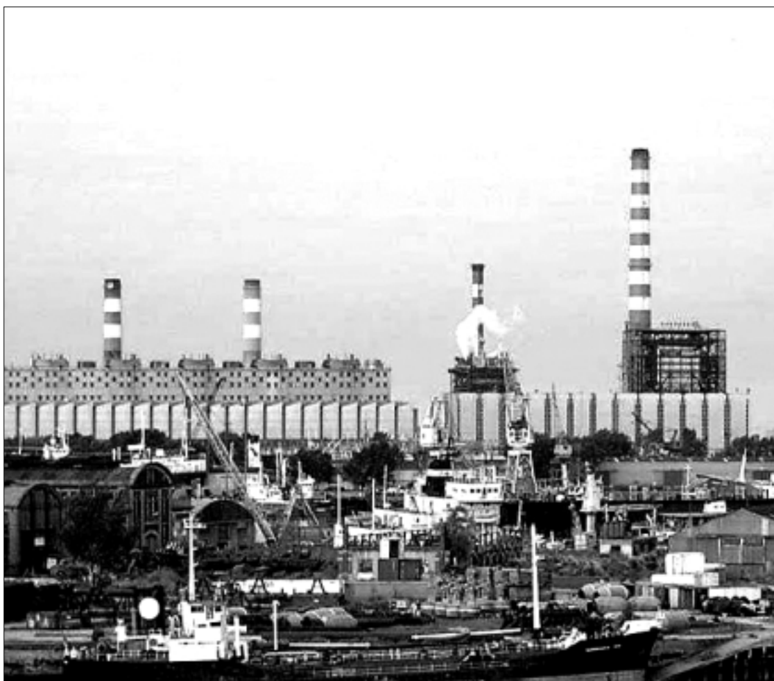
En 2010 se pondrá en funcionamiento un plan de saneamiento del Riachuelo

Según fuentes del Juzgado, "luego del primer plan de reconversión y saneamiento presentado, se dispusieron una serie de objetivos -conformados por 13 puntos- que debe cumplir la ACUMAR, dentro de los que se encuentran por ejemplo: control industrial, limpieza de basurales, limpieza de la mar-