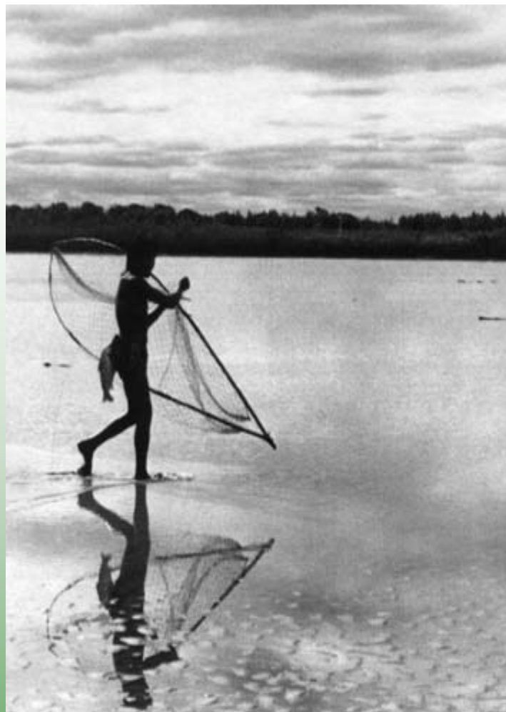
Foto de la cartilla “Ley de Bosques Nativos” elaborada por el equipo de ASOCIANA